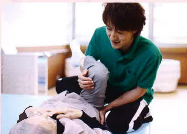
入居者とスタッフの家族のようなふれあい 数多くの看護師や、機能低下を予防する機能訓練指導員が、明るくすこやかな生活をお手伝いします。