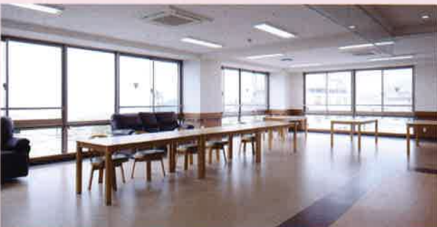
2階、3階フロアー 開放的な窓から別府市の景色が見渡せます。TVを楽しんだり、談笑したり、誰もが使える多目的なリビングです。