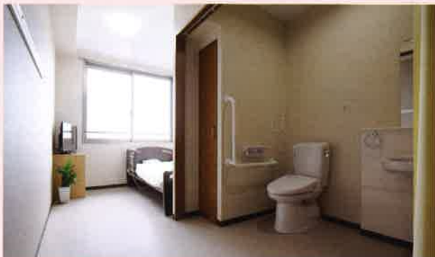
居室(個室) 別府の絶景をのぞむ静かな環境に、エアコン、トイレ、洗面台、テレビ(個室)を各部屋に完備。引き戸・手すり付きの工夫もあり、ご高齢者が落ち着いて暮らせる居室です。