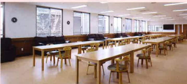
デイサービス 併設のデイサービスのホールでは、食事、憩いのひととき、レクリエーション、リハビリと、さまざまにご利用できます。