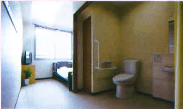
居室(個室) 別府の絶景をのぞむ静かな環境に、エアコン、トイレ、洗面台、テレビ(個室)を各部屋に完備。引き戸・手すり付きの工夫もあり、ご高齢者が落ち着いて暮らせる居室です。