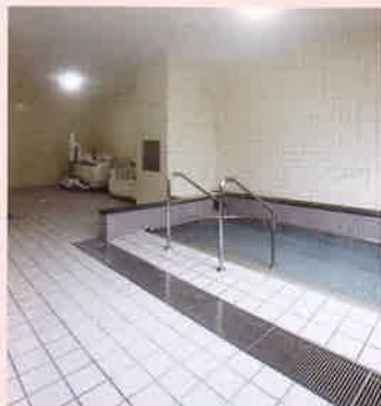
大浴場 別府ならではの天然温泉です。ゆったりとした癒しの浴場と豊富な湯量。お風呂の時間は皆様に喜ばれます。座ったままでも、寝たままでも利用できる機械浴の設備も整っています。