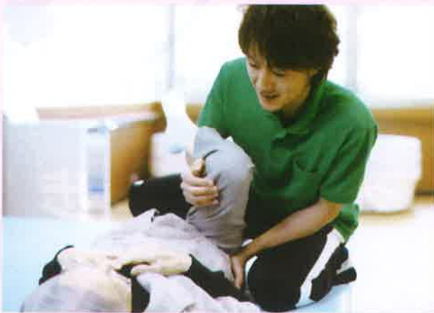
入居者とスタッフの家族のようなふれあい 数多くの看護師や、機能低下を予防する機能訓練指導員が、明るくすこやかな生活をお手伝いします。