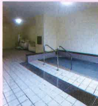
大浴場 別府ならではの天然温泉です。ゆったりとした癒しの浴場と豊富な湯量。お風呂の時間は皆様に喜ばれます。座ったままでも、寝たままでも利用できる機械浴の設備も整っています。