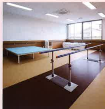
リハビリコーナー 機能回復、維持、予防のための適切なサポートをします。おひとりおひとりとふれあいながら、運動療法・物理療法で日常動作の支援をしています。