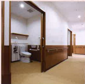
トイレ バリアフリーのトイレは、車いすと介護職員がらくに入れる広さです。シャワー式トイレ、暖房便座の快適空間。冷たい便座による急な血圧上昇の危険はありません。