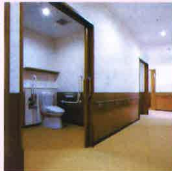
トイレ バリアフリーのトイレは、車いすと介護職員がらくに入れる広さです。シャワー式トイレ、暖房便座の快適空間。冷たい便座による急な血圧上昇の危険はありません。