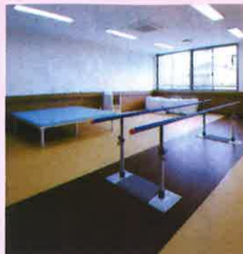
リハビリコーナー 機能回復、維持、予防のための適切なサポートをします。おひとりおひとりとふれあいながら、運動療法・物理療法で日常動作の支援をしています。