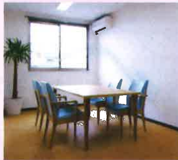
面会室 ケアマネージャーに相談事や、ご家族やお客様が訪れたときに使用していただくため、まわりに気兼ねなく語らえる面会室を用意しました。明るい部屋で、ゆっくりとくつろいでお話しください。