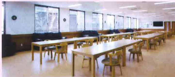
ダイサービス 併設のダイサービスのホールでは、食事、憩いのひととき、レクリエーション、リハビリと、さまざまにご利用できます。