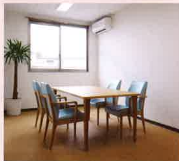
面会室 ケアマネージャーに相談事や、ご家族やお客様が訪れたときに使用していただくため、まわりに気兼ねなく語らえる面会室を用意しました。明るい部屋で、ゆっくりとくつろいでお話しください。