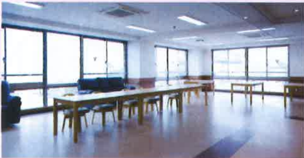
2階、3階フロアー 開放的な窓から別府市の景色が見渡せます。TVを楽しんだり、談笑したり、誰もが使える多目的なリビングです。